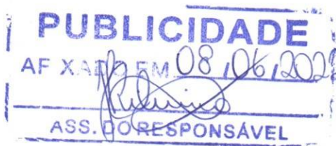
Hélia de Almeida Ribeiro Pregoeira

Edital completo e informações no endereço acima ou fone (38) 3725 - 1110, com a pregoeira.