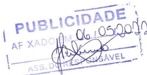
Hélia de Almeida Ribeiro

Edital completo e informações no endereço acima ou fone (38) 3725-1110 com a Pregoeira.